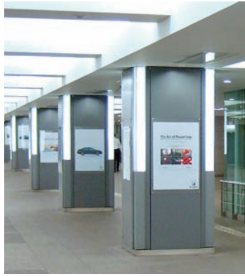
丸ビル前柱シート広告