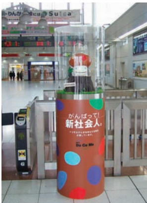
ゲートウェイ広告(大崎駅)

JR品川駅北改札口上に超大型サインボードが出現した。サイズは縦3メートル、横13.5メートルで内照式。クライアントはキヤノンマーケティングジャパン(株)。改札上部という駅の象徴的な場所への広告展開が実現したことも注目される。