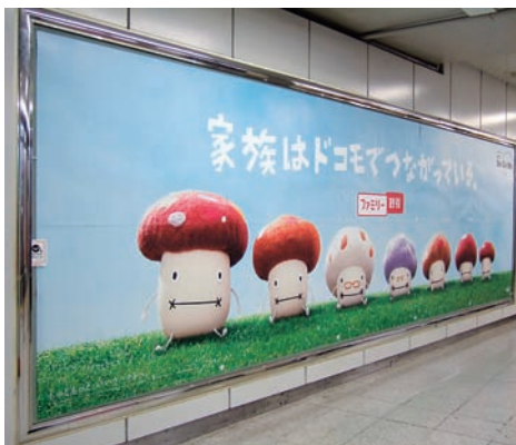
渋谷ハーフジャック