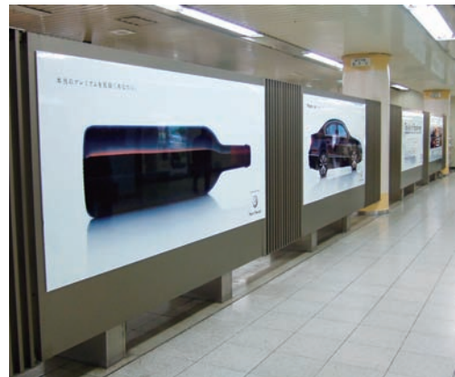
丸の内地下4面シート広告