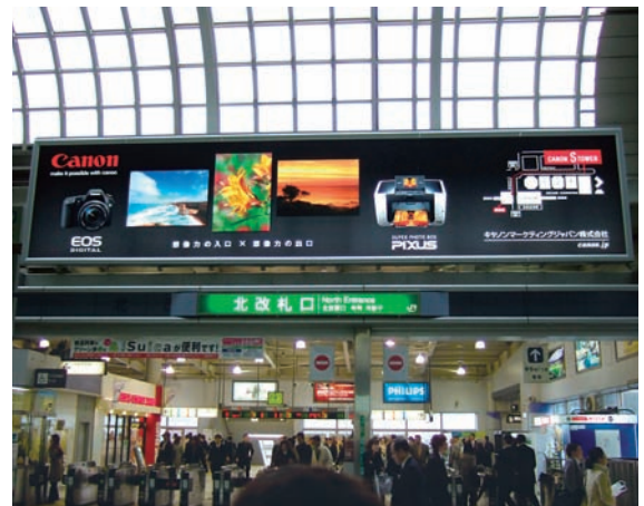
品川駅北改札上部に設置された縦3.0m×横13.5mのサインボード