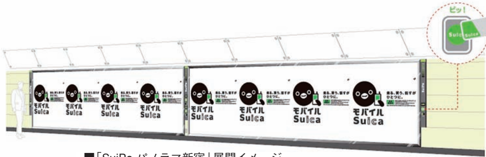
■「SuiPo パノラマ新宿」展開イメージ

J企では、駅ポスター設備にSuicaリーダを設置し、Suicaの機能と駅ポスターを連動させた交通広告媒体「SuiPo(スイポ)」を開発・商品化すると発表した。