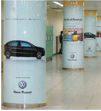
丸の内地下アドピラー

JR東京駅丸の内地下で「フォルクスワーゲングループジャパン(株)」が大規模なSP展開を行った。内容は「丸の内地下4面シート広告」「丸の内地下通路アドピラー(10本)」「丸の内地下南口前アドピラー(31本)」「丸の内地下丸ビル前柱シート広告(23面)」で、期間は3月28日(火)～4月10日(月)。 丸の内地下のこれらの媒体はJRと地下鉄、丸ビル、東京国際フォーラムを結ぶ通路に位置することもあり注目を集めている。