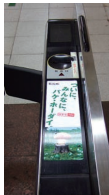
自動改札ステッカー