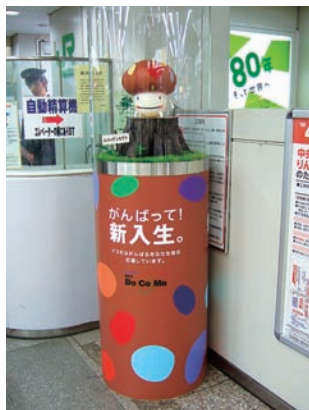
ゲートウェイ広告(渋谷駅)